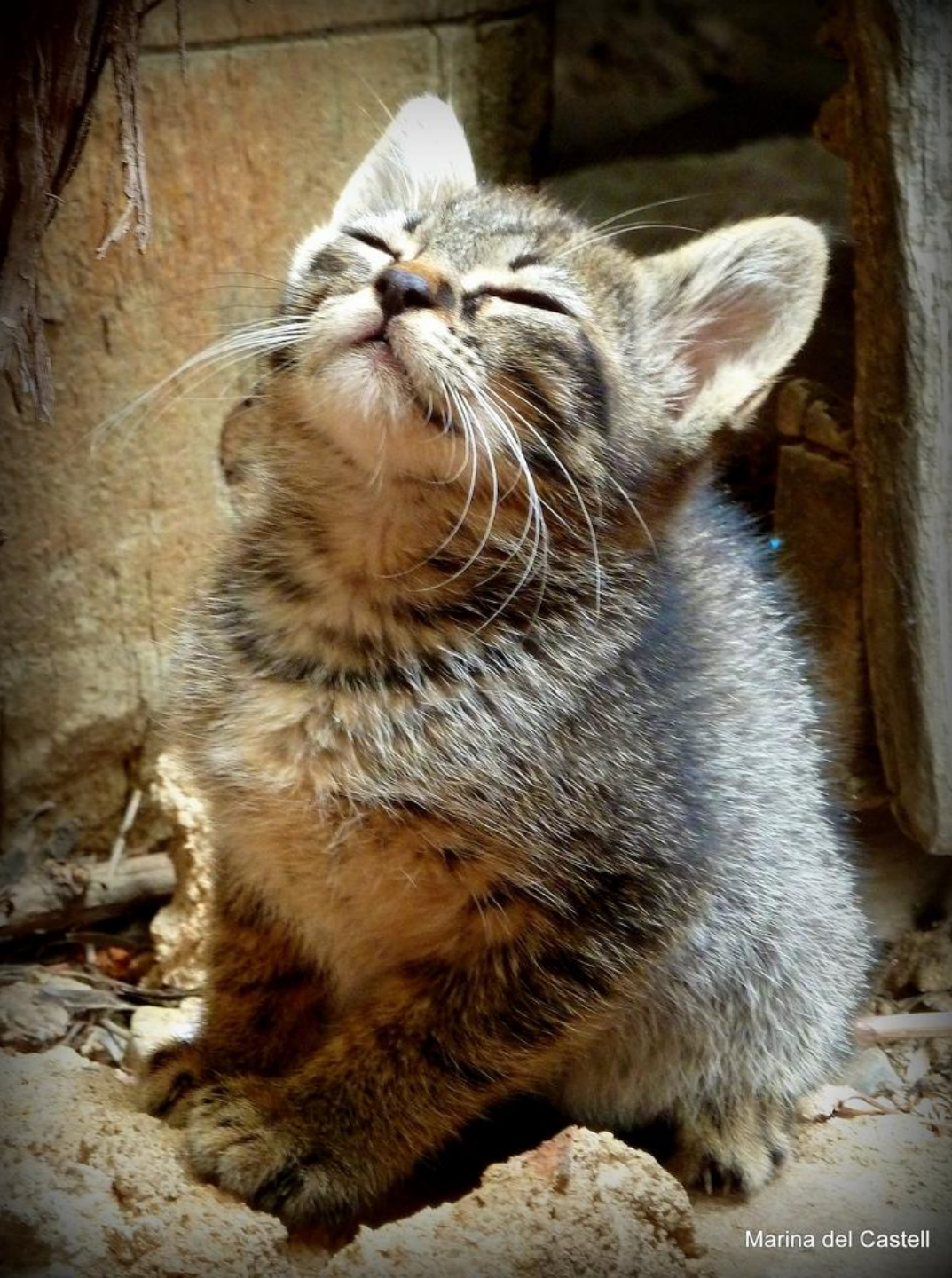
Marina del Castell